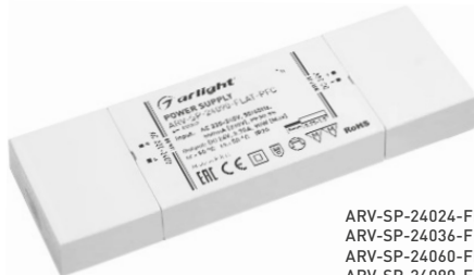
ARV-SP-24024-FLAT-PFC ARV-SP-24036-FLAT-PFC ARV-SP-24060-FLAT-PFC ARV-SP-24090-FLAT-PFC ARV-SP-24120-FLAT-PFC