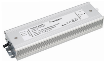
ARPV-12200-B1 ARPV-24200-B1 ARPV-24300-B1